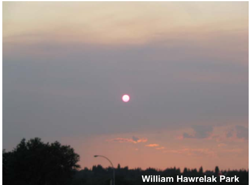
William Hawrelak Park

Visit ATA website at www.thaiassociation.ab.ca