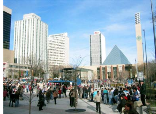
A Celebration of Edmonton's 100 th Birthday at City Hall and Churchill Square.

ATA joined force with the City of Edmonton in the celebration of Edmonton's 100 th birthday.