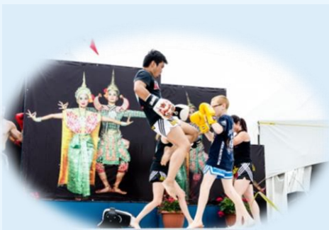
2014 Thai pavilion at the Heritage Days