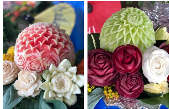
ATA's Fruit carving program

A very successful recreational program offered at the end of last year was "Introduction to Succulent Arrangements" in collaboration with the St. Albert Greenhouses ( photos page 8 ). We will be organizing this type of activities again in the near future.