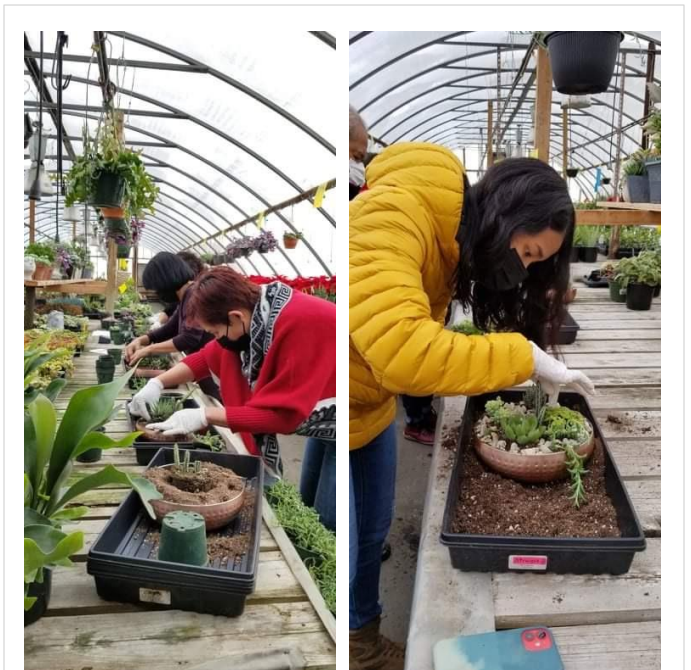
A workshop: “Introduction to Succulent Arrangements”, Dec 12, 2021

ในด้านนันทนาการ ที่จัดขึ้นเมื่อปลายปีที่แล้ว คือ การสอนการ จัด ไม้ อ ว บ น้ำ (Introduction to Succulent Arrangements) โดยจัดร่วมกับ St. Albert Greenhouses โครงการนี้ได้รับความสนใจและประสบความสำเร็จเป็นอย่างดี จึงทำให้เห็นว่า สมาคมฯ น่าจะจัดโครงการประเภทนี้ขึ้นอีกในอนาคต