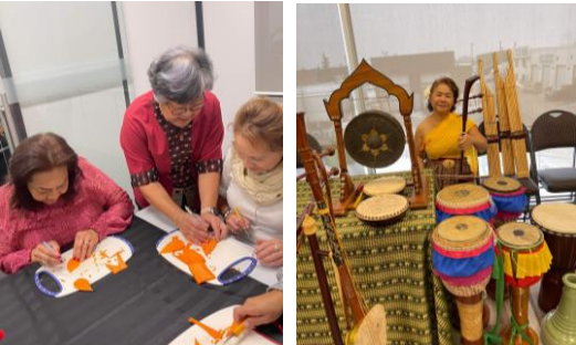
ATA Open House, January 15, 2023

The ATA hosted a successful Open House at the Thai Centre on January 15, 2023. Around 50 people, including many newcomers to the Association, attended the event. It served as a platform to showcase and raise awareness about Thai culture, featuring engaging activities such as food sampling, fruit carving, captivating Thai dance performances, and enchanting classical music. Moreover, the Open House also doubled as a membership drive, encouraging individuals to join the Association and become part of the vibrant community.