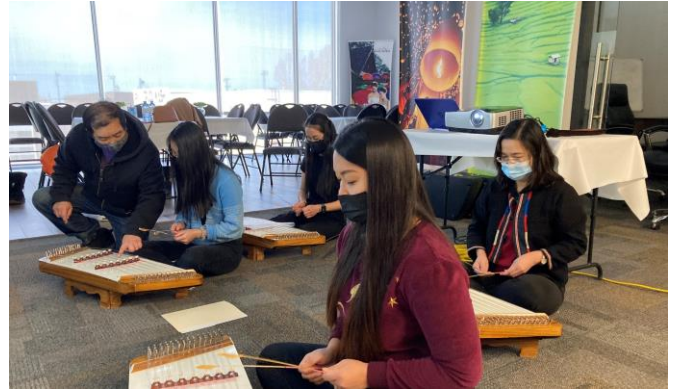
The first "khim" lesson was offered at the Thai Centre on Feb 26, 2022