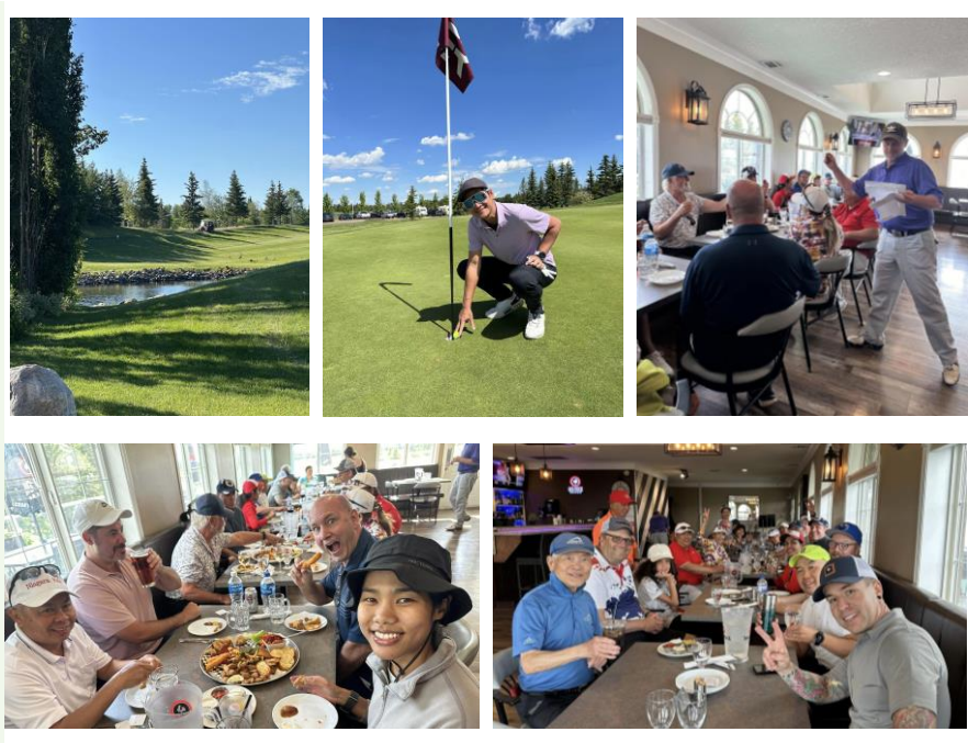
ATA Golf Tournament at Eagle Rock Golf Course, June 23, 2024 . There were 30 golfers from Edmonton Calgary and Red Deer participated in this annual event. We wish to thank ATA and many donors for their generous sponsorship of food and prizes.

การแข่งขันกอล์ฟของสมาคมฯ จัดขึ้นเมื่อวันที่ 23 มิ.ย. 2024 ณ Eagle Rock Golf Course มีนักกอล์ฟจำนวน 30 คนจากนครเอ็ดมันตัน แคลการี่ และเรดเดียร์เข้าร่วมแข่งขัน คณะผู้จัดขอขอบพระคุณสมาคมไทยในอัลเบอร์ตาและผู้มีอุปการะคุณทุกท่าน ที่ได้ร่วมกันบริจาคเงินค่าอาหารและของรางวัลสำหรับการแข่งขันในครั้งนี้