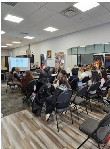
2024 AGM at the ATA Thai Centre การประชุมสามัญประจำปี 2024 ณ สำนักงาน ของสมาคมฯ