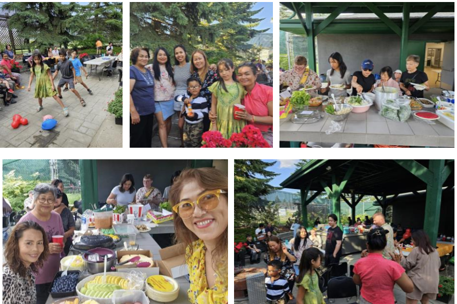
ATA Picnic at North Millbourne Community League Hall, July 14, 2024. About 100 members and friends brought so much delicious dishes to share with one another at this fun-filled family event.

งานปิกนิกประจำปีของสมาคมฯ จัดขึ้นเมื่อวันที่ 14 ก.ค. 2024 ณ North Millbourne Community League Hall มีผู้มาร่วมงานราว 100 คน มีอาหารเลิศรสจำนวนมากที่ครอบครัวต่างนำมาช่วยรับประทาน และมีการเล่นเกมส บรยากาศสนุกสนานดังที่เห็นในภาพ